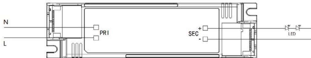
Schéma de câblage

La longueur maximale d'un câble doit être de 2 m.