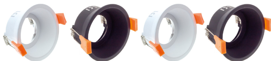
IP20 Blanc 5021025