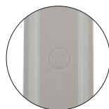
Trou prépercé à l'arrière pour câblage central