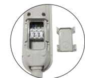
Connecteur automatique déclinable