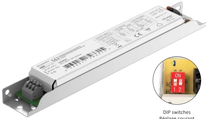
DIP switches Réglage courant