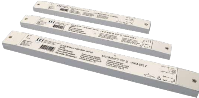
Schéma de câblage