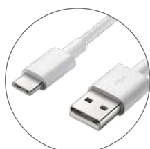
Livré avec un Câble USB / USB-C