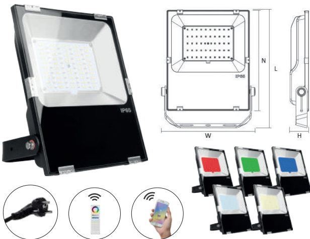
Transmission automatique du signal + synchronisation