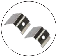
Clips en inox