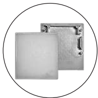
Capuchons sans vis