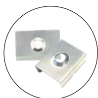
Clips de fixation