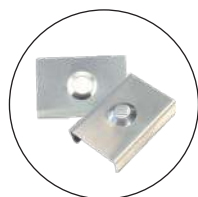
Clips de fixation invisibles