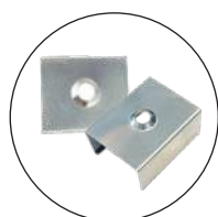
Clips de fixation