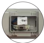
Connecteur automatique et switch 3000-4000K derrière le capot déclinable