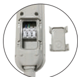
Connecteur automatique déclipable